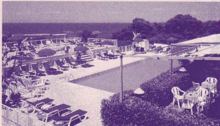
Piscine de l'hôtel Elma Park

Vous trouverez de plus amples informations dans notre catalogue « Les Romands en Balade » (p. 64 - 80). Vous pouvez aussi appeler le 032 / 391 01 11.