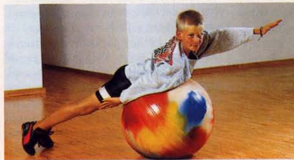
Die Einsatzmöglichkeiten des Sitzballs bei Spiel, Sport und in der Therapie sind äusserst vielfältig.

Aus Sicherheitsgründen, wegen Unfallgefahren und um die nachbarschaftlichen Beziehungen nicht zu strapazieren, lohnt es sich, gemeinsam ein paar Regeln aufzustellen. Toleranz und Respekt – gegenseitig – stehen im Vordergrund! Es sind Tage und