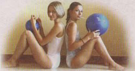
Vor dem Üben Sballs mit Luft füllen.

Als Bewegungspädagogin arbeite ich seit vielen Jahren intensiv mit den großen Gymnastikbällen. In meiner Weiterbildung zur Spiraldynamik-Lehrkraft sowie in meinen diversen Spiraldynamik-Lehrgängen war meine Ballarbeit – Spiraldynamik auf dem Ball – während Jahren sehr beliebt. In dieser Phase wuchs mein Wunsch nach einem kleineren Ball, der 3-dimensionale Bewegungsabläufe mit Elastizität und Weichheit optimal unterstützt und fördert. Ich wollte meine Arbeit mit Maß-Bällen präzisieren und weiterentwickeln.