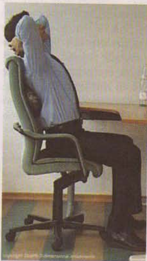
Rückenpflege im Büroalltag.

nügender Ausdauer positiv veränderbar. Lehrkräfte haben die Möglichkeit, in jeder Wochenlektion entsprechend einzuwirken. Der „Röntgenblick“ erlaubt, während des Trainings greifbare Gruppen- und Einzelkorrekturen vorzunehmen. Bewegungsqualität wird in der Gesamtkoordination neu definiert.