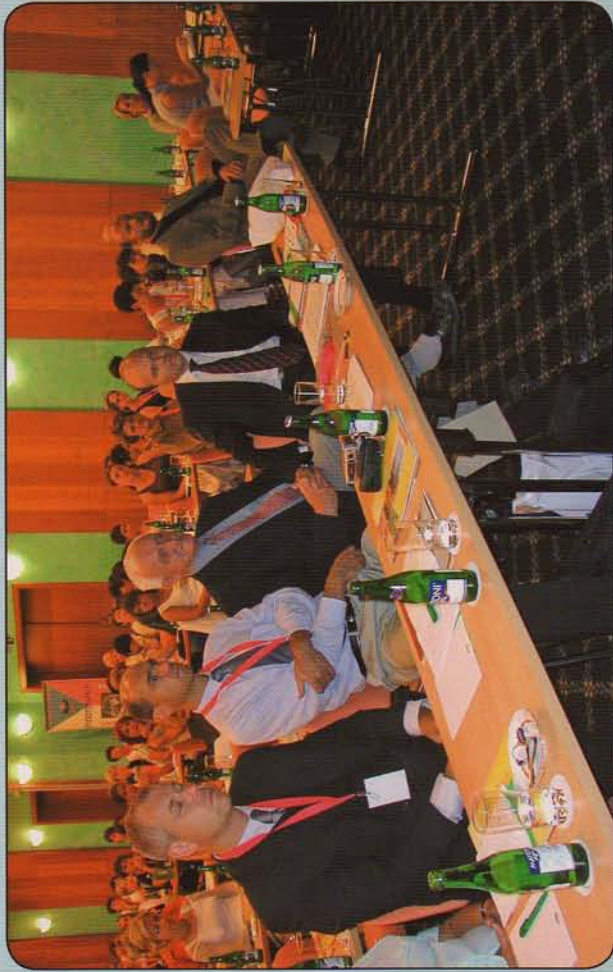
2. mezinárodní konference fyzioterapeutů ČR v Brně 9. - 10. září 2005